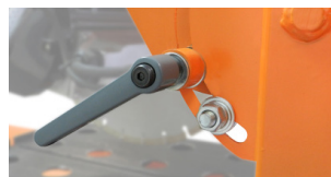
NASTAVITELNÁ RUKOJEŤ HLOUBKY ŘEZU