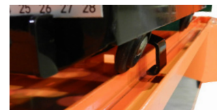
SYSTÉM VEDENÍ STOLU