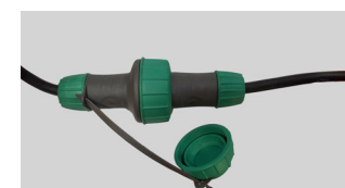
RYCHLOSPOJKA NA ČERPADLO