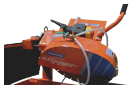
NAKLÁPĚCÍ ŘEZNÁ HLAVA (90° - 45°)